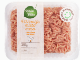
PIŠČANČJE MLETO MESO