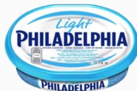
LAHKI KREMNI SIR